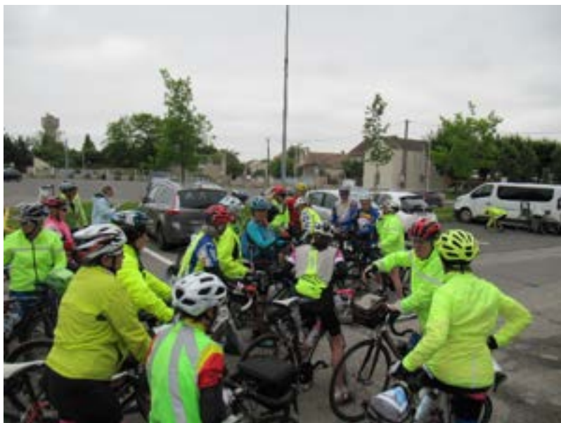
Rencontre et briefing avant le départ pour rejoindre Villeneuve St Georges

Comme beaucoup de clubs franciliens, les cyclos du Bondoufle Amical Club ont également participé à l'accompagnement de groupes provinciaux dans le cadre de l'opération Ensemble à Paris 2024 de notre fédération de cyclotourisme. J'avais tout d'abord eu contact avec un groupe de Dacquois qui devait passer par Bondoufle, mais finalement leur lieu d'hébergement étant dans le 94, ils ont modifié leur parcours et sont passés plus à l'est de la Seine.