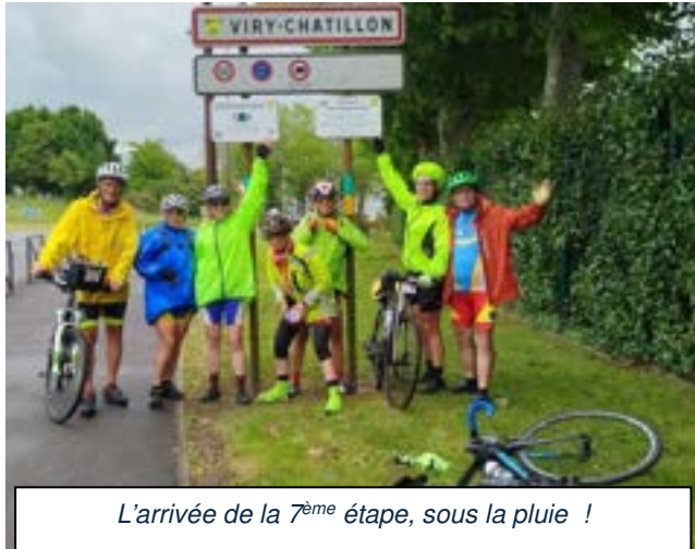
L'arrivée de la 7 ème étape, sous la pluie !

Le CoDep des Bouches-du-Rhône travaillait depuis 3 ans sur ce projet, et bien qu'habitant l'Essonne j'ai eu la chance de participer au voyage de Miramas à Paris : environ 850 km, 8000 m de dénivelé positif, en 7 étapes ! 45 participants dont 3 accompagnateurs aux petits soins pour ceux qui roulaient.