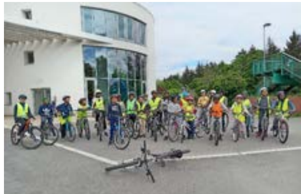
Bloc3 ; Un groupe d'Ormoy à la piscine de Mennecey

Ormoy : Ici aussi c'est le CoDep qui assure les 3 blocs dans les 2 groupes scolaires. 30 élèves à Pasteur et 25 à St Jacques, une belle réussite et des enfants là encore très motivés et heureux de pratiquer à chaque bloc. Cerise sur le gâteau lors de la sortie : passer au parc de Fontenay-le-vicecomte ou dans les allées du parc de Villeroi à Mennecey. C'est plus dur dans les rues d'Ormoy quand il faut monter sur le plateau depuis la mairie, mais tout le monde y arrive.