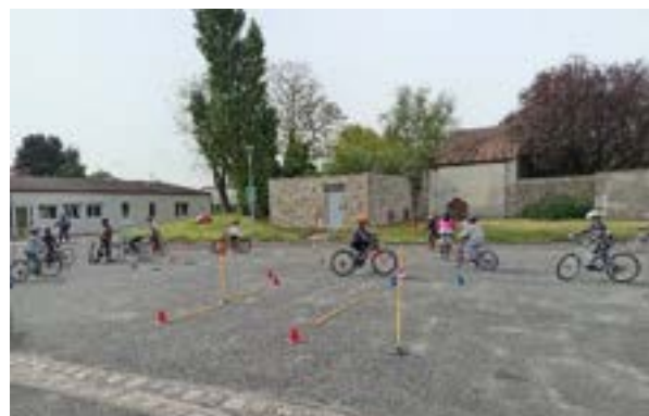
Bloc2 : Exercices de maniabilité et respect du code

Bondoufle : Le club a réalisé pour sa 13 ème année consécutive, la formation au SRAV dans les 4 groupes scolaires. 6 classes de CM2 pour 154 élèves ont ainsi effectué le programme. Il faut regretter que certains parents ne s'inquiètent pas de l'état des vélos. Il faut revoir à chaque étape les vélos pour effectuer les exercices et déplacements en sécurité, surtout lors du bloc 3, pendant la pratique sur voirie en autonomie, pour les arrêts aux stops ou respect de la priorité à droite. Également le changement de vitesse qui ne peut être effectué avec un BMX, lors des exercices en montée et descente.