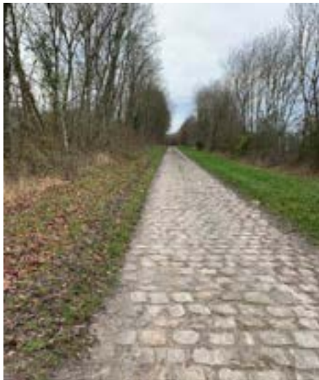
Rue pavée à Saint-Chéron